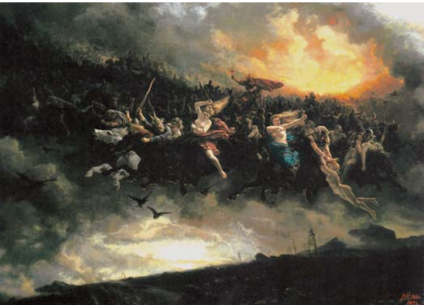
Åsgårdsreien of De Wilde Jacht, een schilderij gebaseerd op Odins mythologie, door Peter Nicolai Arbo (1872).