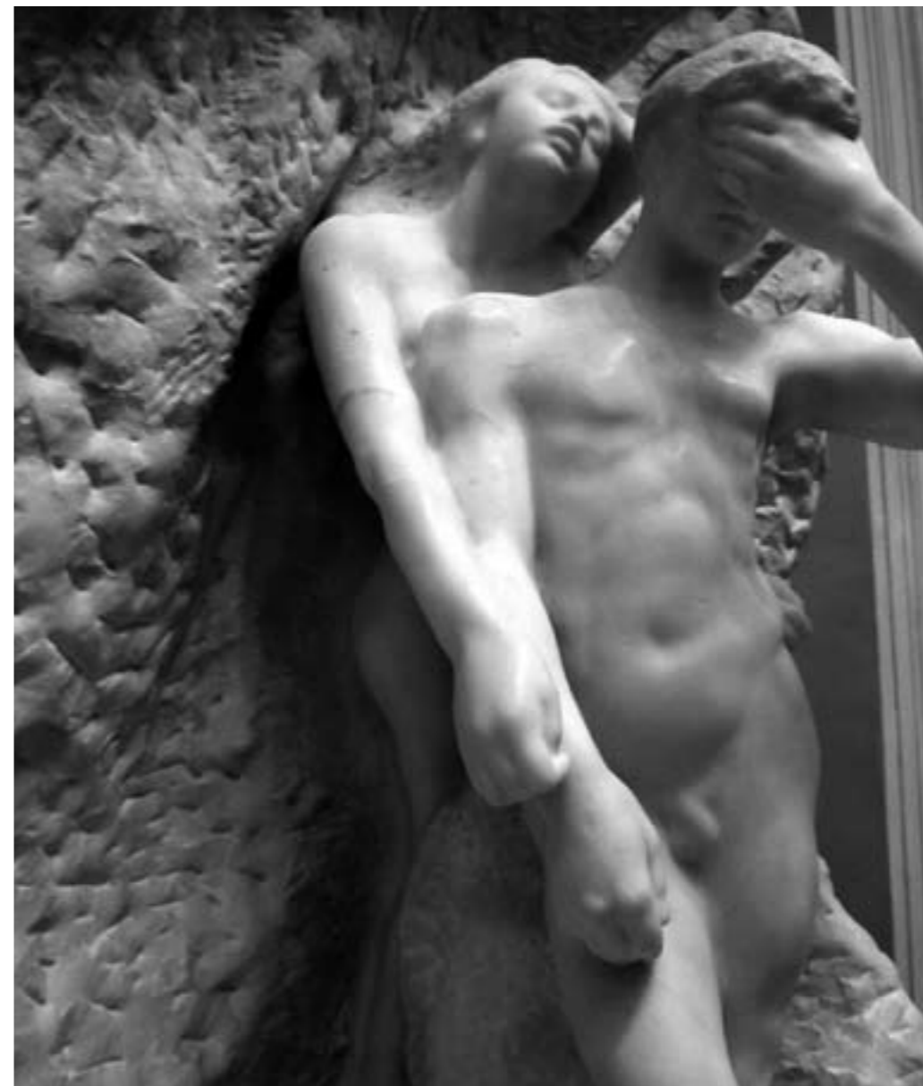
Prachtig drukt Rodin in marmer de vertwijfeling van Orpheus uit, en hoe Eurydice weer wegzinkt in de rots, de nacht van Hades. 1893, New York: The Metropolitan Museum of Art

In veel mythische verhalen heeft het begrip ‘wateren’ betrekking op de onzichtbare kracht- en energiestromen die de macrokosmos, de kosmos