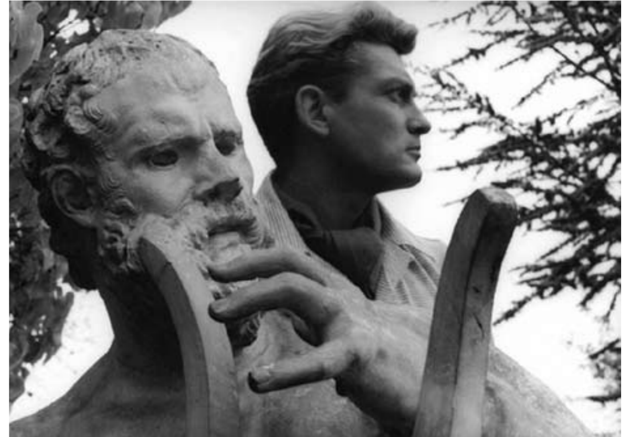
In 1949 creëerde Jean Cocteau (1889-1963) een spraakmakende film 'Orphée', (Orpheus) met in de hoofdrol de toenmalige hartebreker Jean Marais (1913-1998).

In de universele leringen, en zeker ook in de orfische mysteriën moest de kandidaat op het pad van bevrijding daarom tweemaal sterven: de