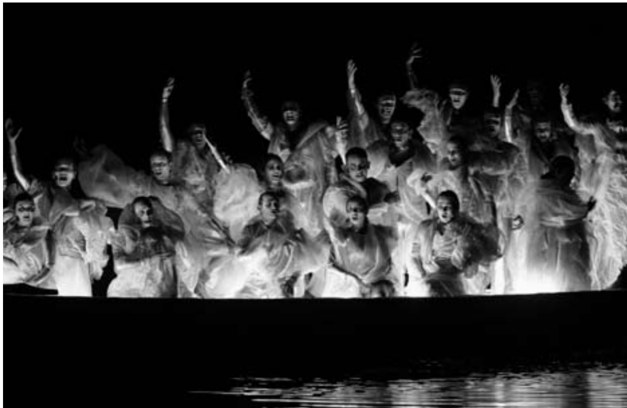
beeld uit de opera orfeo ed eurydice c. w. von glück, juli 2011, paleis soestdijk, nederland

Het is als een angstdroom, zo heeft men ons in de literatuur geleerd, en de god drijft allen tot steeds heftiger waanzin; hij is de grote jager en de vrouwen die hem dienen zweept hij op als jachthonden. Wie heeft nog nimmer gehoord van de bacchanten? Het zijn in de dionysische waanzin opgezweepte vrouwen, die in gruwelijke razernij als verscheurende dieren huishouden. Wat moeten wij van dat alles denken, wat men ons geleerd heeft en wat men ons zonder enig begrip als sagen en legenden opdist? En wat zulk een duivelse reflex gehad heeft op de Romeinse decadenten? Is ook bij ons de alcoholist niet de mens die Bacchus dient? En is het niet zo, dat men het legendarische en mythische van de oude mysteriën als feiten stelt om dialectische grofheden en zonden te accentueren? Zal het daarom niet heel moeilijk zijn, deze naar wijn en ontucht riekende mysteriën te ontdoen van hun sluiers en ze te gebruiken als roep tot het nieuwe leven? In het geheel niet, want de signatuur van een goddelijke boodschap is in deze mysteriën zó duidelijk, dat een kind het zou kunnen verstaan.