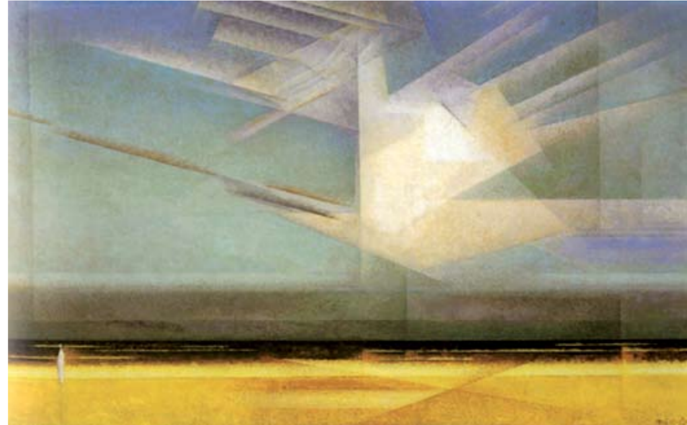
Ook de Bauhauskunstenaar Lyonel Feininger was in 1926 gegrepen door het machtige beeld van een vogel, oprijzend uit de storm. Lyonel Feininger, Vogelwolke (Wolke nach dem Sturm) , 1926. Cambridge: Busch-Reisinger Museum, Massachusetts, VS

DE FENIKS, SYMBOOL VAN DE BEVRIJDING De vuurvogel staat voor het vuur van de geestkracht en voor de vogel die de absolute vrijheid tegemoet vliegt. Dat vuur van de geest kunnen we als het ware geloof beschouwen: een eigen, innerlijke verbinding met de wereld van de